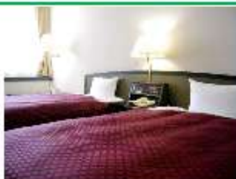
ゆったりとした広さ (28㎡) ツインルーム