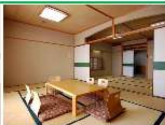
畳の心地よい書りで癒される広々な和空間