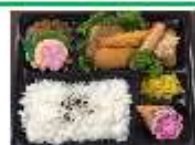
朝食はスポーツ弁当になります。