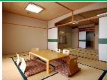
畳の心地よい書りで癒される広々な和空間