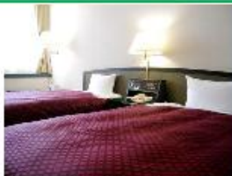
ゆったりとした広さ (28㎡) ツインルーム