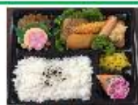
朝食はスポーツ弁当になります。