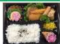
朝食はスポーツ弁当になります。